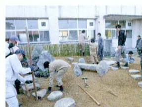
飛石の敷設 実際に飛石の上を歩いてみて、合端やチリ、打ち方を確認しながら敷設する。