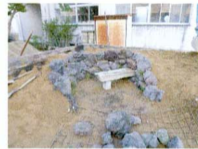
石積み 石の質感から天端を不揃いこさせ石積みに動きを持たせた。

私たちは三年間、造園に関する専門的な知識や伝統的な技能を学ぶことで、日本庭園の魅力にとりつかれました。そこで、日本庭園の美しさを文化祭に訪れるお客様への歓迎作品として庭づくりに挑戦しました。今年の文化祭テーマは『TRY ~新たな挑戦~』。石積みや景石、植栽の配置にこだわり、植栽された木々の紅葉で季節の移ろいを感じることができる日本庭園を作庭することで、建物の外観だけではなく、住まいにおける庭の価値を高める庭づくりに挑戦しました。