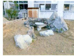
水鉢周り 石積みと主石が一体感を持つように主石の配置にこだわった。