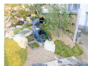
苔の貼り付け 枯葉などを取り除いた苔を目地が目立たないようになじみよく貼り付ける。