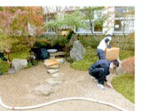
敷砂利 庭の置くから手前へ砂利を敷いていく。