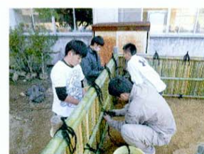
銀閣寺垣の作製 結束位置を割り出してから、玉飾り、ねじりいぼで結束する。