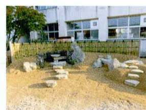
庭の全体像 植栽、苔の貼り付けと数砂利の工程となってきた。