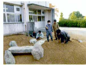
石橋と中島 石橋には橋挟み石の役石を配置。中島もかまぼこ型状になるように粗整地する。