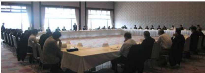
総支部長・支部長合同会議の様子