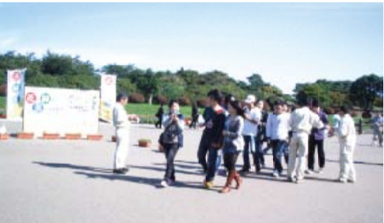
函館・五稜郭公園のようす

札幌滝野すずらん丘陵公園会場では、会員12社13名が揃いの「みどりのジャッパ」を着用して、「エコアツプクイズ大会」と「葉っぱカルタ勝ち抜き選