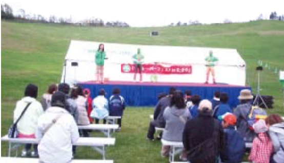
札幌・滝野すずらん丘陵公園会場のようす

北海道総支部は、『花と緑で美しい日本を』を掛け声として、10月9日(土)に札幌の「国営公園滝野すずらん丘陵公園」で、10月11日(月)には函館の五稜郭公園での2会場ダブル開催しました。