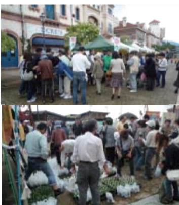
和歌山マリリーナシティ：イコラストリート④、会場⑤と配布時のようす⑥

ヨットやクルーザーを停泊しているメンバーに送付される、毎月発行のイベント情報紙に、日造協造園フェスティバルのパンジーのポット苗や種子の無料配布、造園相談といったイベント案内を同封していただきました。