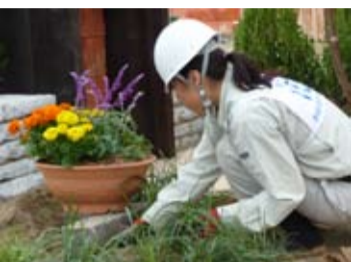
競技のようす(右上下)イメージパース(左上)と造園競技会場の全景(左下)