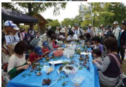
家族揃っての集合写真をリピートのきっかけに