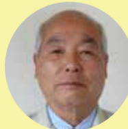
吉田 茂 氏