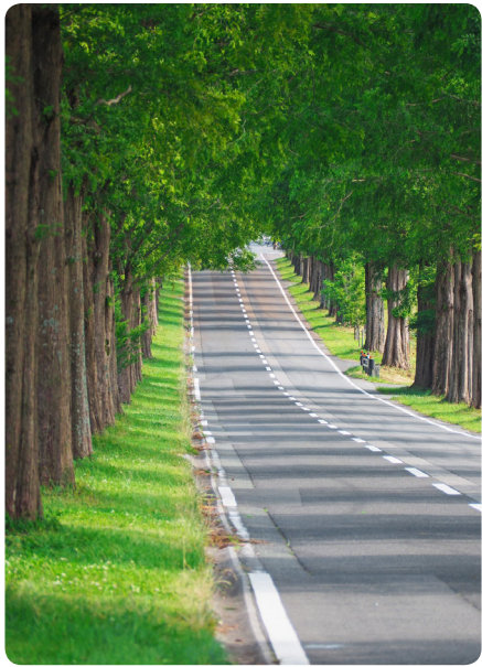
メタセコイア深緑

琵琶湖の生態系を乱す外来魚・ブラックバスをおいしくいただく「よそのコロッケ」も人気です。