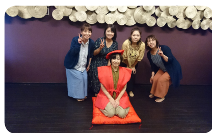
赤いちゃんちゃんこ