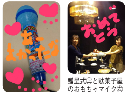
贈呈式①と駄菓子屋のおもちゃマイク⑤

0ちゃんが駄菓子屋で買ったおもちゃのマイク（笑った）5つ用意し（私は運転手なので持てず）みんなで歌いました。その案をだしたのは私なのに、最初から感極まってるうまく歌えなかったけど、みんなで熱唱しました。