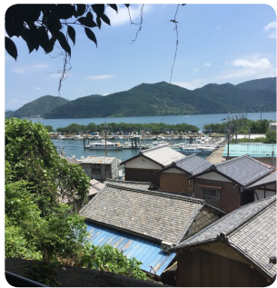
沖島の猫たちと町並み