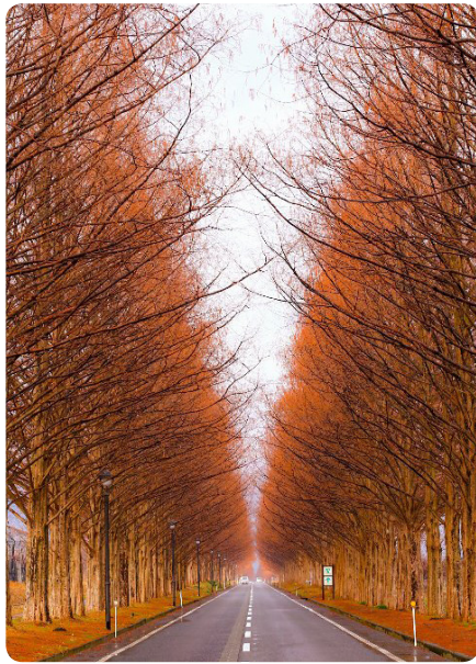
メタセコイア紅葉

高島市鶴川にある白鬚神社は大鳥居が琵琶湖に浮かぶ様子から近江の厳島と言われ、近年はパワースポットとしても有名になりました。