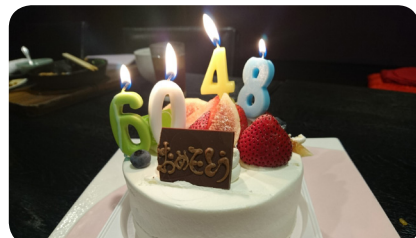
前日が誕生日のMちゃんも一緒にお祝い