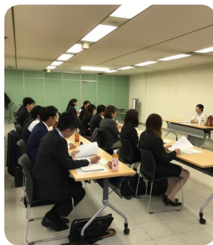
北海道出前講座のようす

すでに北海道と四国で実施。四国では就職希望の高校生と先生の参加もありました。アンケートでは高評価をいただいています。