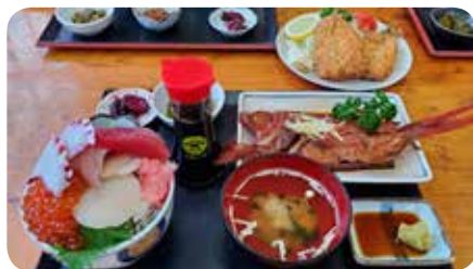
季節の海鮮をぜひご賞味ください