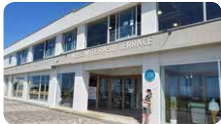
犬吠テラス。目の前に太平洋が広がります