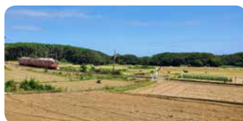
のどかな風景の中を走る銚子電鉄