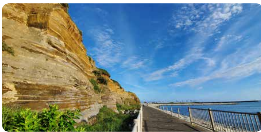
屏風ヶ浦。夕陽に染まる頃がおすすめです