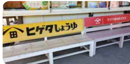
銚子電鉄駅舎のベンチ