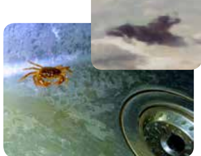
会社の手洗い場に登場するカニ

丈夫で、手の平大の大きさに成長するアシダカグモも徳島ではよく目にするのでテンションがあがります！一時期、家の中でも同居？してたので楽しかったです。いつのまにか引越してしまったようですが……。