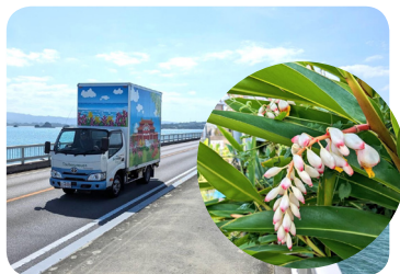
「うりずん」を告げる月桃 首里城復興応援車両

の屋根や歴史を感じさせる石畳の道が残り、ゆるやかな風が時の流れをそっと運んでくれ風情ある街並みが今でも残っています。