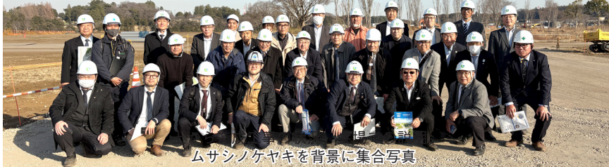
ムサシノケヤキを背景に集合写真

技術委員会では、2月6日(金)の定例の委員会開催に合わせて、2027年国際園芸博覧会特別委員会委員や出展関係の日造協会員と共に、GREEN × EXPO2027の会場視察を行ったので報告する。