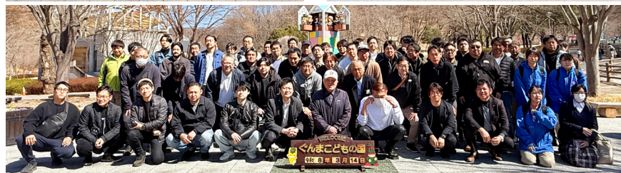
2日目 各コースの集合写真

東・甲信総支部や群馬県支部会員の皆様のご協力により盛会のうちに終えることができました。ご協力いただいた関係者の皆様、また参加いただいた皆様の