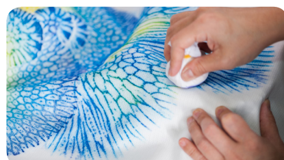
首里琉染「サンゴ染め」