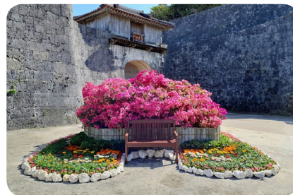
首里城の花まつり

沖縄へお越しの際にはぜひ首里にもお立ち寄りいただき、魅力あふれる風情と文化にふれてみてはいかがでしょうか。