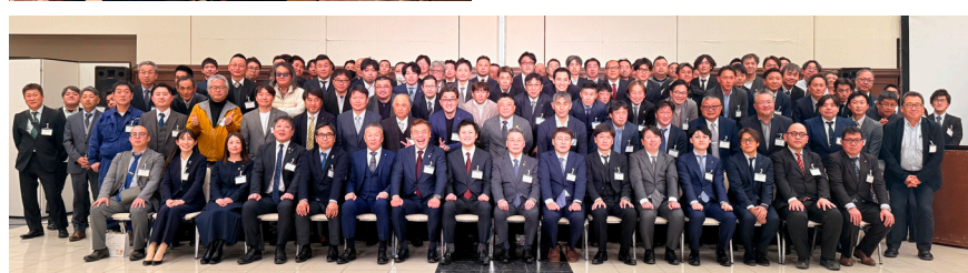
1日目の講演⑤とワークショップ⑥ 集合写真⑦