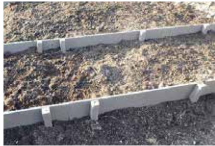
緩斜面の土壌流出防止用土留め

め、好評を博しております。屋上用立上げ壁として、リプラスタンドも好評です。安価・軽量で設置が簡易な上、曲面立上げ壁も可能になりました。設計・見積りも致します。