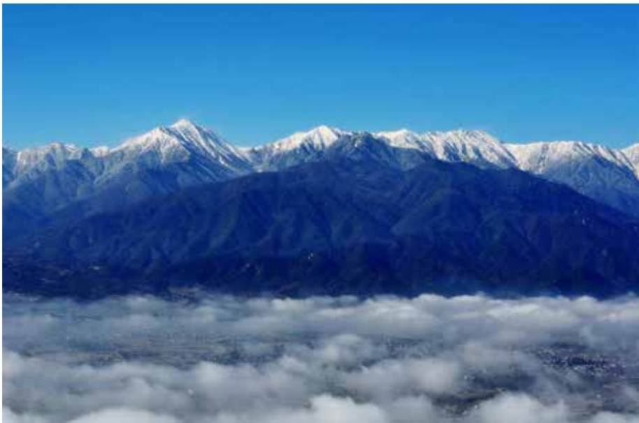
長峰山から雲海と北アルプス

南出(株) 〒513-0801 三重県鈴鹿市神戸 7-8-5 TEL:059-382-0040 FAX:059-383-6526 http://www.minamidekk.co.jp