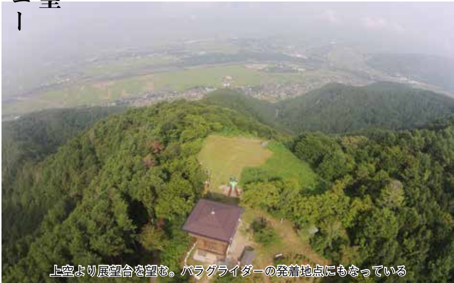
上空より展望台を望む。パラグライダーの発着地点にもなっている

◆ 山頂付近には「長峰山天平の森」という宿泊施設があります。施設内のコテージには5人まで泊まることができ平日は1棟7,140円からとリーズナブル。館内では安曇野名物の円揚げ（つぶらあげ）を使った天平定食（1,200円）や信州サーモンの唐揚げ丼（970円）などがおススメ。大浴場から見る山と安曇野の夜景は息をのむほど。