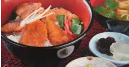
信州サーモン唐揚げ丼