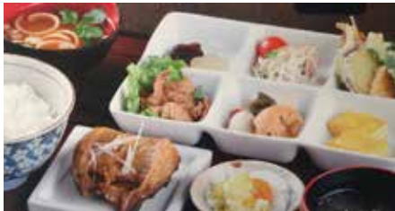
天平定食 1,200 円