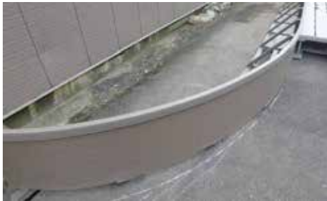
曲面立上げ壁 笠置付 L1,800xH400mm