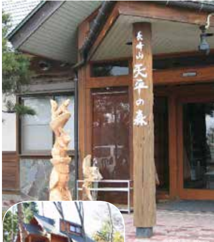
近隣の施設天平の森とコテージ (公式ページより)