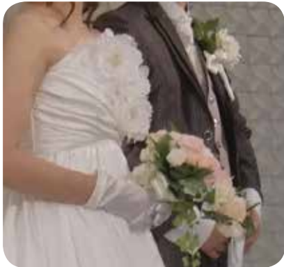
新婦が持つ「ブーケ」と新郎の胸の「ブートニア」

前述の事が生かされるのは主に趣味やプライベートであり、肝心の仕事はまだまだ未熟ですが、結婚式では誰よりも泣いてしまうほど涙もろくなり年齢だけは重ねたと思う一日でした。