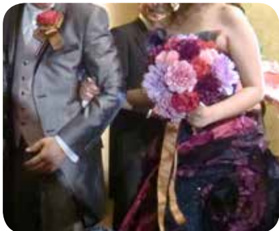
お色直しでのブーケとブートニア

編集後記 9 月に入り毎日のように雨続き。気が滅入ってしまいます。今月号の編集打ち合わせも大雨の日になってしまいましたが、部会メンバーと雨宿りに立ち寄った加●屋で心だけは晴れやか？になりました。