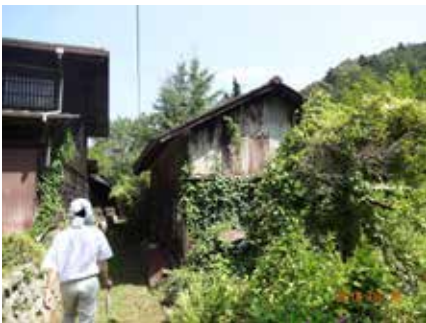
空き家と耕作放棄地

また、都市内で増加する空き地を“新たな生き物の生息空間”として捉え、都市の生物多様性保全や生態系回復へと繋げていくことも考えられるだろう。北米では復元生態学（Restoration Ecology）が台頭し、生態系回復を通じて社会的にも荒廃した地区の再生が試みられている。日本においても、そのような考え方