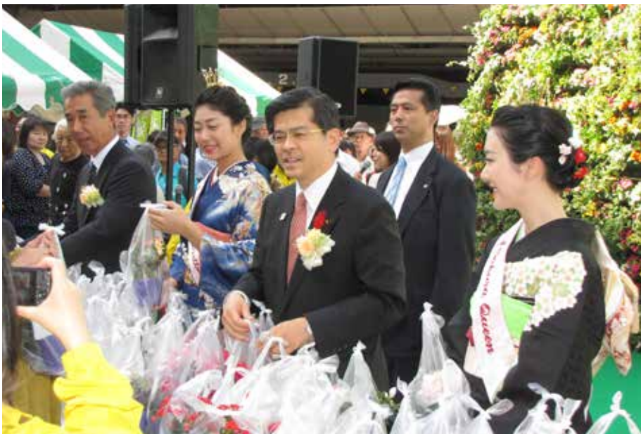
石井啓一国土交通大臣（中央）、富田祐次都市緑化推進運動協力会長（最左）が花鉢配布を行った

「都市緑化キャンペーン2016」が10月7日、東京都千代田区の有楽町駅前広場で行われた。