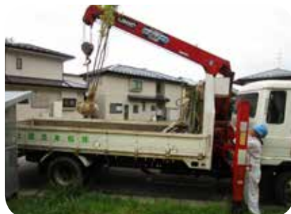
仕事の幅を広げるクレーン等の資格